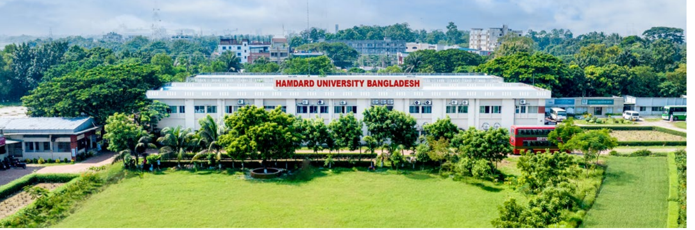
হামদর্দ বিশ্ববিদ্যালয় বাংলাদেশ, গজারিয়া, মুন্সিগঞ্জ