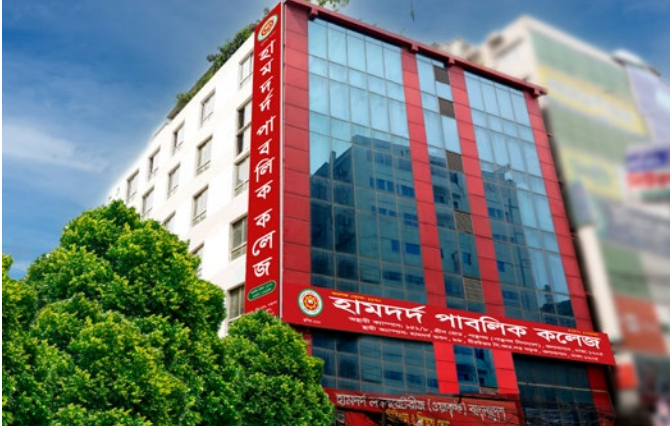
হামদর্দ পাবলিক কলেজ, ঢাকা