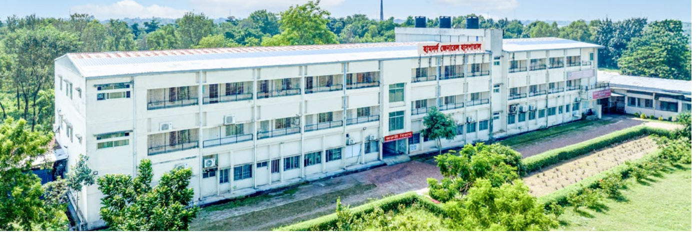
হামদর্দ জেনারেল হাসপাতাল, গজারিয়া, মুন্সিগঞ্জ