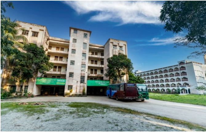
আয়েশা (রা.) মহিলা কামিল মাদরাসা, লক্ষ্মীপুর