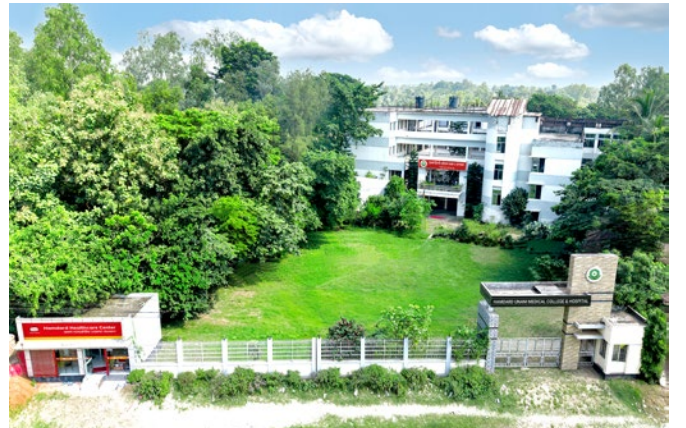
হামদর্দ ইউনানী মেডিকেল কলেজ ও হাসপাতাল, বগুড়া