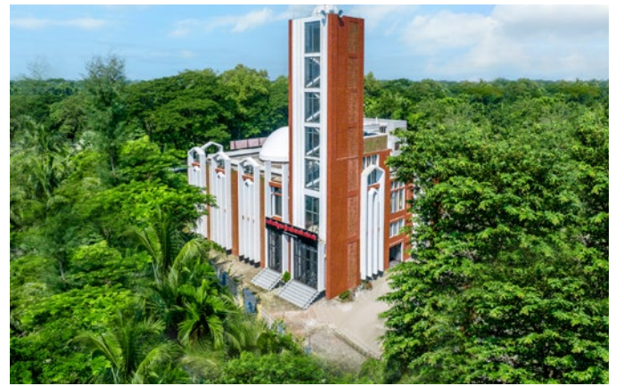
ড. হাকীম মো. ইউছুফ হারুন ভূঁইয়া কেন্দ্রীয় জামে মসজিদ ও রিসার্চ সেন্টার, লক্ষ্মীপুর