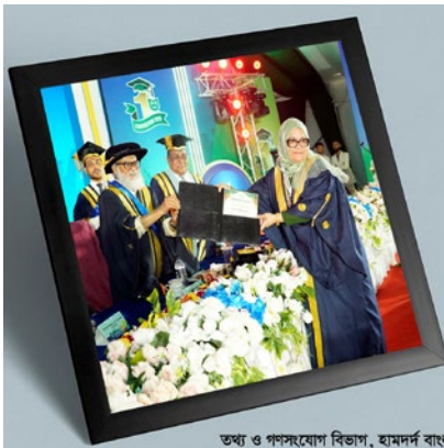
তথ্য ও পসংযোগ বিভাগ, হামদর্দ বাংলাদেশ

এক বর্ণাঢ্য আয়োজন এবং উৎসবমুখর পরিবেশের মধ্য দিয়ে সম্পন্ন হলো হামদর্দ বিশ্ববিদ্যালয় বাংলাদেশের 'প্রথম সমাবর্তন ২০২৬'। ৩১ জানুয়ারি ২০২৬, মূলীগঞ্জের গজারিয়ায় অবস্থিত বিশ্ববিদ্যালয়ের নান্দনিক স্থায়ী ক্যাম্পাসে এই মাহেন্দ্রক্ষণ উদযাপিত হয়। এই মাহেন্দ্রক্ষণে বিভিন্ন অনুষদ ও বিভাগের মোট ১ হাজার ৭৫৪ জন শিক্ষার্থীকে আনুষ্ঠানিকভাবে ডিগ্রি প্রদান করা হয়।