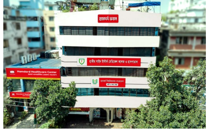
হাকীম সাজিদ ইস্টার্ন মেডিকেল কলেজ ও হাসপাতাল, ঢাকা