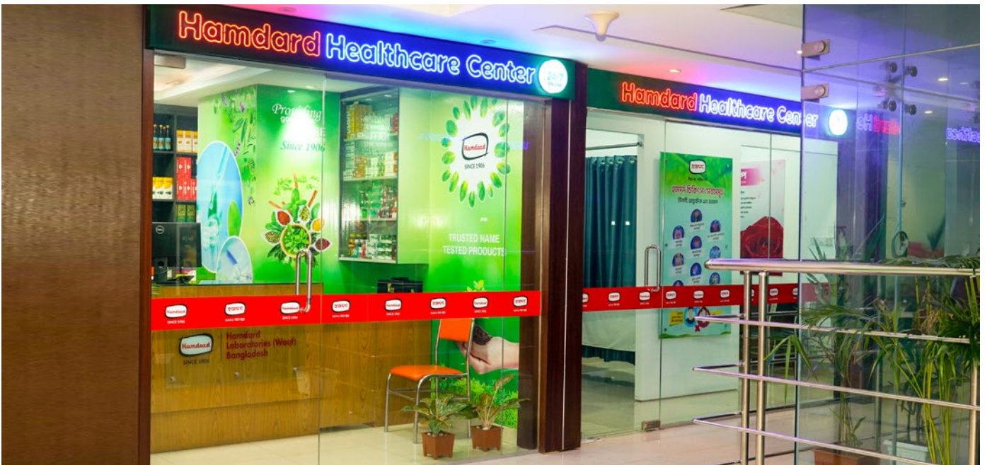
দেশব্যাপি ৩০০ ফ্রি হেলথ কেয়ার সেন্টার, হামদর্দ